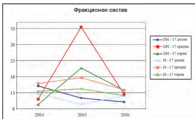
Графикон 2. Интеракциски ефект на сортата, годината и инсерцијата Fig. 2. The interaction effect of the variety, year and insertion

врз коефициентот на фракциите од испитуваните сорти тутун, имале годината и инсерцијата, додека влијанието на сортите било статистички значајно. Исто така, анализата на варијансите покажува статистички значаен интеракциски ефект помеѓу сортите, годините и инсерциите.