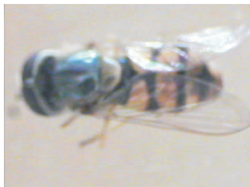
Сл. 5. Женка од E. corollae Photo 5. Female of E. corollae