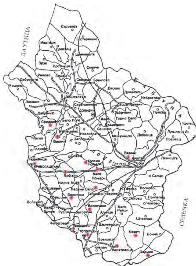
Карта 1-Распространетост на видот E. corollae во прилепскиот тутунопроизводен реон метод: косење со кечер

На Карта 1 е прикажана распространетоста на видот E. corollae , утврден со методот косење со кечер во прилепскиот тутунопроизводен реон. Во нашите испитувања видот е малуброен; го констатиравме на ливади, во повлажните терени во селата Средорек и Вранче, како и во терените со интензивно земјоделско производство, каде што покрај тутунот се одгледуваат многубројни зеленчукови култури, бостан и овоштарници.