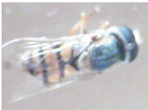
Сл. 4. Мажјак од E. corollae Photo 4. Male of E. corollae

Просечната тежина кај мажјаците беше 9,6mg, а кај женките 11,9mg.