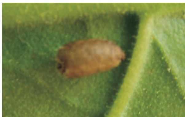
Сл. 3. Кукла на тутунски лист

Пупариумот е формиран од последната ларвена кошулка и ги има бојата и шарите на ларвата од трет ларвен степен. Веднаш по куклењето, куклата е мека и нежна, а со развитокот, станува потврда. Таа е со кафена, жолтокафена или бежовокафена боја, полуовална и покриена со фини боцки. На грбот се наоѓаат црни трансверзални пруги. Абдоменалната површина на задниот дел е малку конкавна, а задниот дел е малку свиткан надолу.