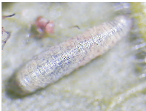
Сл. 1. Ларва во L_1 Photo 1. Larva in L_1

Тежината во L_1 се движи од 0,6 до 5mg, или просечно 2,52mg. Должината во L_1 варира од 1 до 5mm или во просек 3,9mm, а ширината од 0,3 до 1,2mm или просечно 0,8mm.