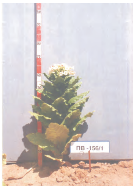
Слика 2 - Прилеп 156/1 Figure 2 - Prilep 156/1

Врз основа на претходно наведените собрани и анализирани параметри, за секоја сорта тутун од различните локалитети е дадено мислење за нејзините производни и квалитетни својства, како и за нејзината адекватност во соодветните услови на производство.