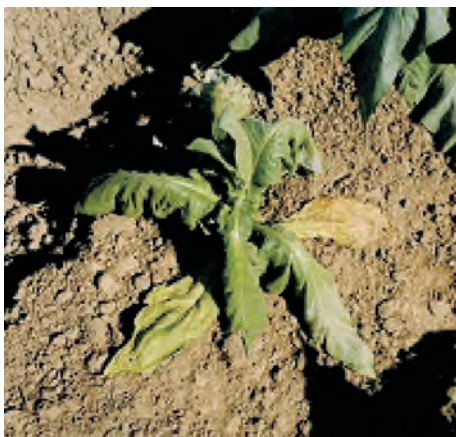
Слика 8. Заболен тутун од Phytophthora parasitica var. nicotianae Photo 8 Tobacco infested with Phytophthora parasitica var. nicotianae