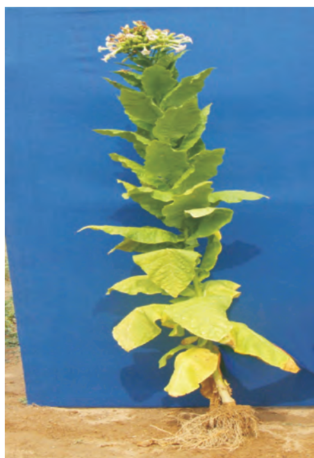
Слика 2. ЈК - 48 Photo 2 ЈК - 48