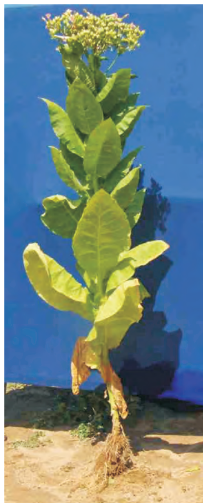
Слика 4. FL - 301 Photo 4 FL - 301