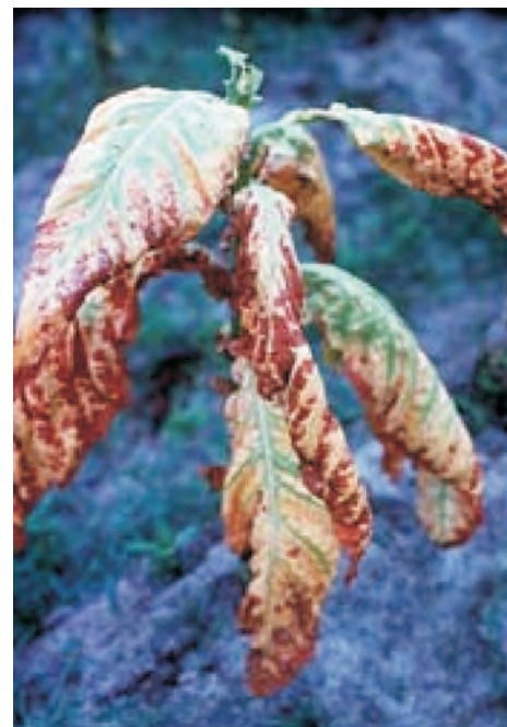
Слика 9. Заболени тутунски лисја од Phytophthora parasitica var. nicotianae Photo 9 Tobacco leaves infested with Phytophthora parasitica var. nicotianae