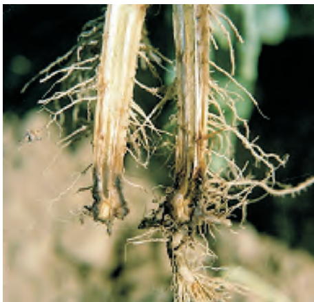
Слика 7. Корен на заболен тутун од Phytophthora parasitica var. nicotianae Photo 7 Tobacco root infested with Phytophthora parasitica var. nicotianae