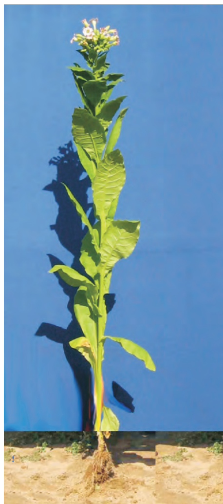
Слика 3. П - 2 Photo 3 P - 2