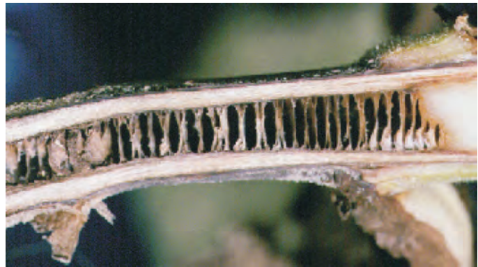
Слика 6. Стебло на заболен тутун од Phytophthora parasitica var. nicotianae Photo 6 Tobacco stalk infested with Phytophthora parasitica var. nicotianae