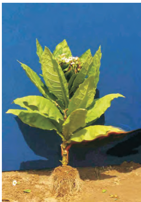
Слика 1. П 12-2/1 Photo 1 P 12-2/1