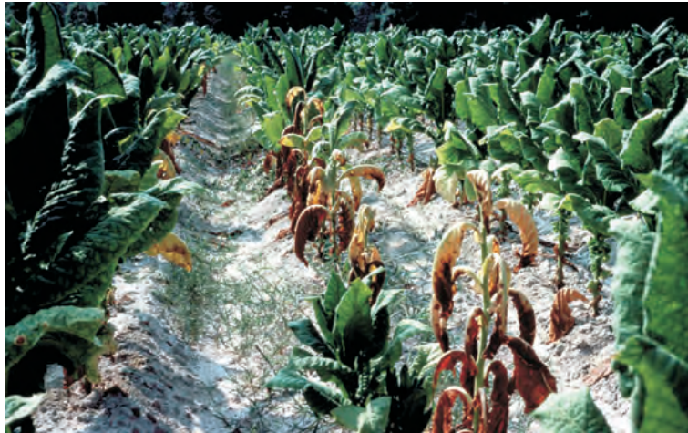
Слика 10. Тутунски насад оболен од Phytophthora parasitica var. nicotianae Photo 10 Tobacco plants infested with Phytophthora parasitica var. nicotianae