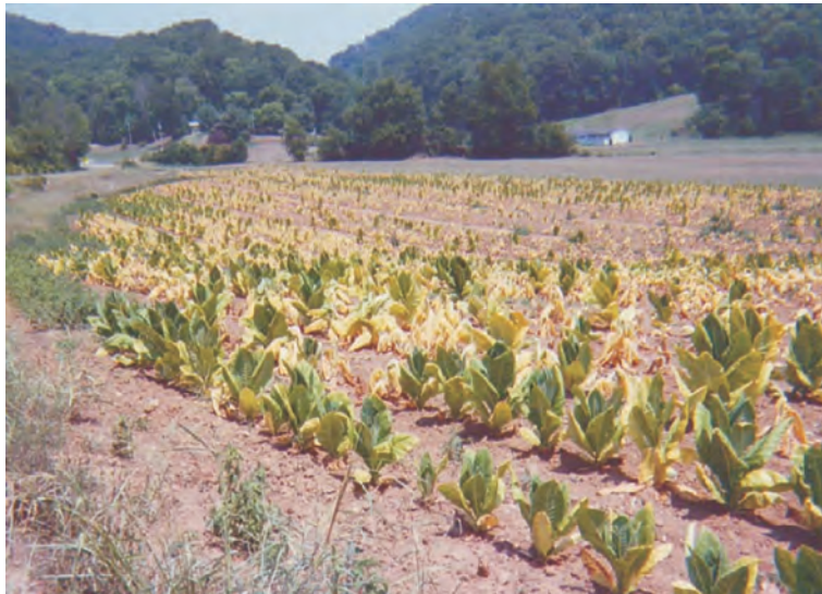
Слика 11. Тутунски насад оболен од Phytophthora parasitica var. nicotianae Photo 11 Tobacco plants infested with Phytophthora parasitica var. nicotianae