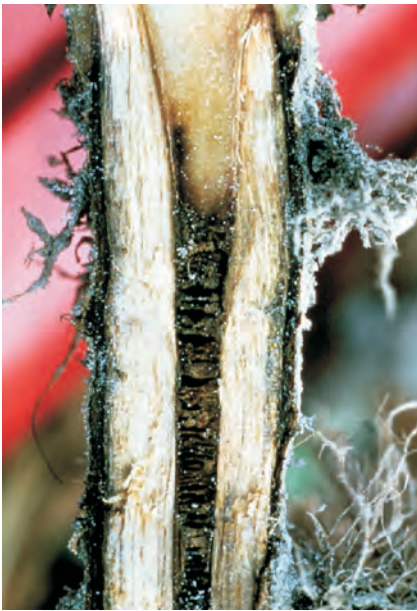
Слика 5. Стебло на заболен тутун од Phytophthora parasitica var. nicotianae Photo 5 Tobacco stalk infested with Phytophthora parasitica var. nicotianae