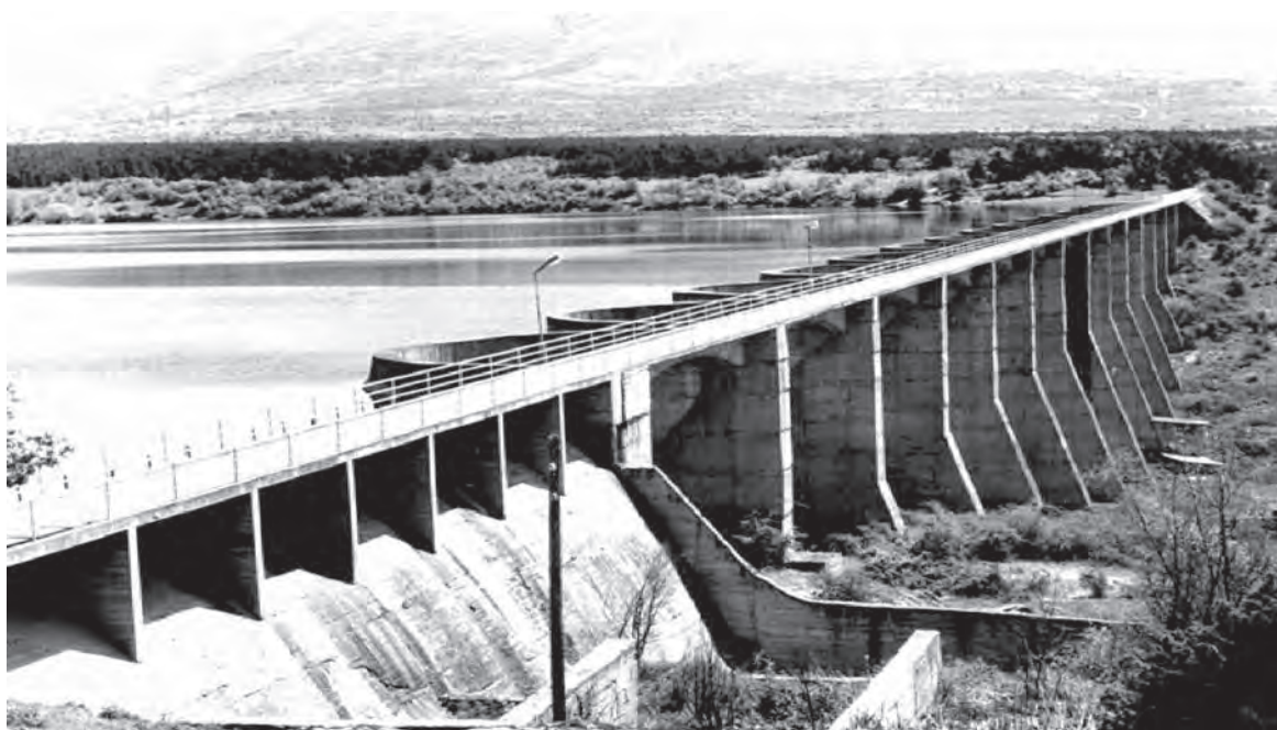
Слика 1 Изглед на браната со акумулацијата Photo.1 View of the dam with accumulation

Левата и десната падина зафаќаат површина од по 3 000 ha, а дотур на вода се обезбедува преку челичен сифон Ш 800 mm, со максимален проток од 750 l/s. Од главниве цевоводи понатаму се делат разделните цевоводи - секундарната мрежа. Тие се изградени од азбест-цементни цевки со максимален пречник Ш 450mm за левата и 300 mm за десната падина и минимален пречник Ш 150mm и за двете падини. На левата падина минималниот притисок во каналската мрежа во високата зона изнесува 2at., а во ниската зона 8at. На десната падина