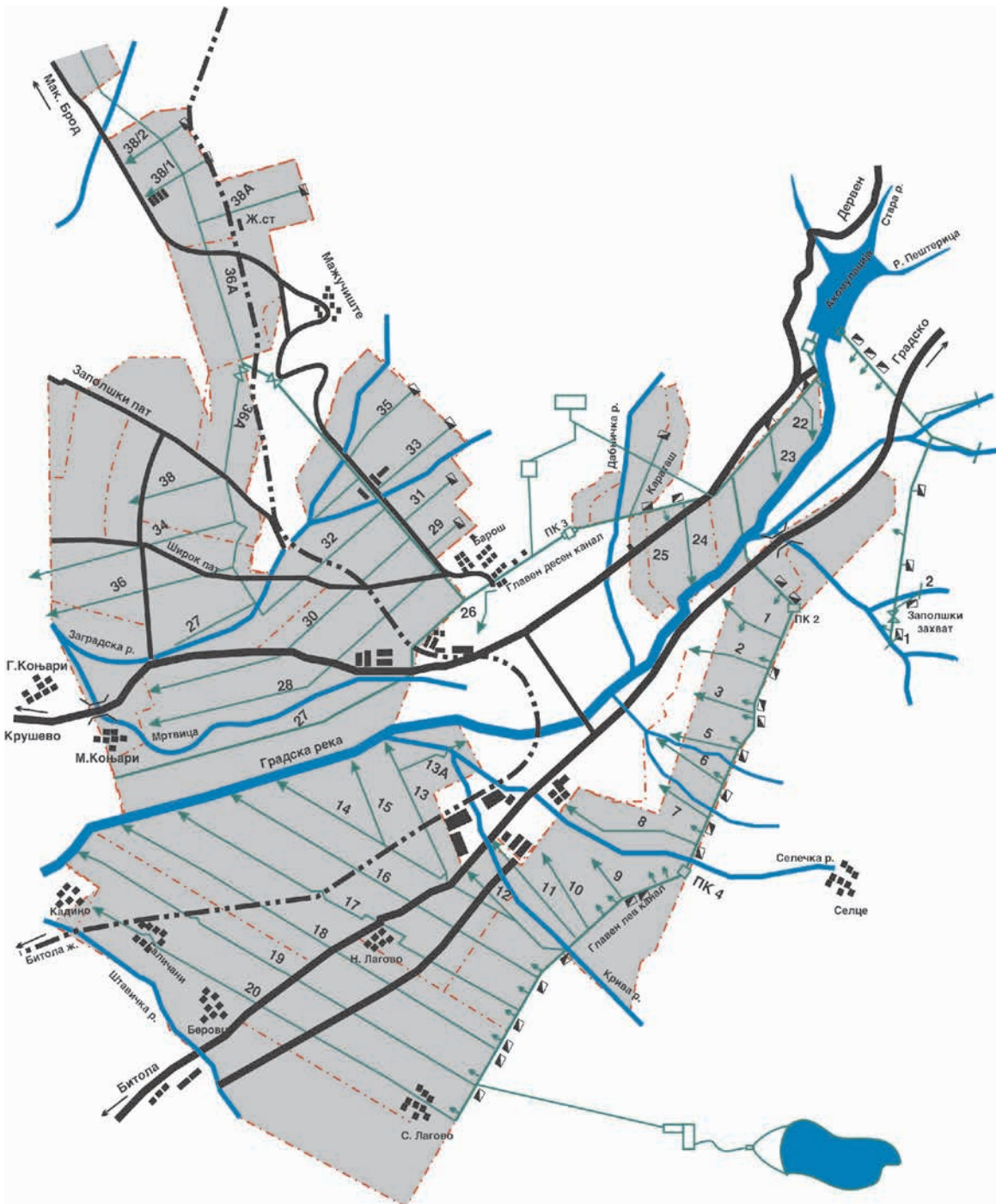
Слика 1 Просторна распространетост на каналската мрежа од ХС "Прилепско поле" - Прилеп Scheme 1 Distribution of the cannal system

Целосната каналска мрежа на ХС "Прилепско Поле" работи под притисок по пат на гравитација и е целосно од затворен