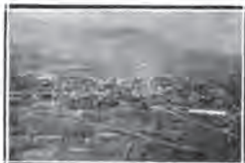
Prilep, ogleđ sa Solenke planine, duđanska beđa uđrada: Stovarišnje neprerađenih duvana

Još u predratnom vremenu Monopolška Uprava uviđala je značaj Opišnih Stanica u cilju poboljšanja proizvodnje duvana. Ona je godine 1910. osnovala u Aleksincu Ogleđnu stanicu koja je 1911. godine ošpočela rad. Na ovoj stanici vršeni su razni ogleđi. Kao glavniji radovi bili su: primena veštačkog đubreta, fitopatološki ogleđi t. j. suzbijanje bolesti i štetočina duvanskih, zalamanje duvana; selekcioniranje t. j. izđvajanje najboljih