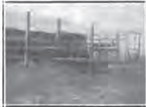
Покретна Сушница опитне станице.

spektiva rada naše Opitne Stanice veoma ozbiljna, jer će u skoroj budućnosti njen plod ne samo podići kulturni nivo našeg proizvođača, već će služiti i na podizanju narodnog blagostanja. Na nama je —