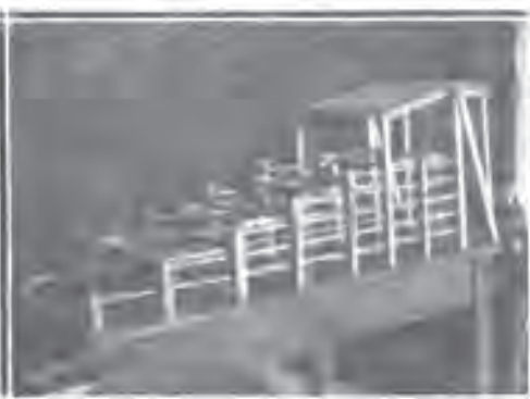
Модел култивације управника станица Боје Милошевића.

bitus, spoljna obeležja kako sorata kao celine tako i pojedinih tipova. Zatim su proučene morfološke osobine izdvojenih duvana, delom i anatomska složenost lista, debljina tkiva, lisne malje, stomé i pokožica. Tokom vegetacije vođene su zabeleške o dobu i načinu sazrevanja lista, otpornosti prema suši i bolestima. Potom se vodilo računa o porastu lišća na stabljici, dužini internodija, broju listova osobito vršnih, veličini i obliku listova, nežnosti tkiva, kao i uglu koga list sa stabljikom zatvara.