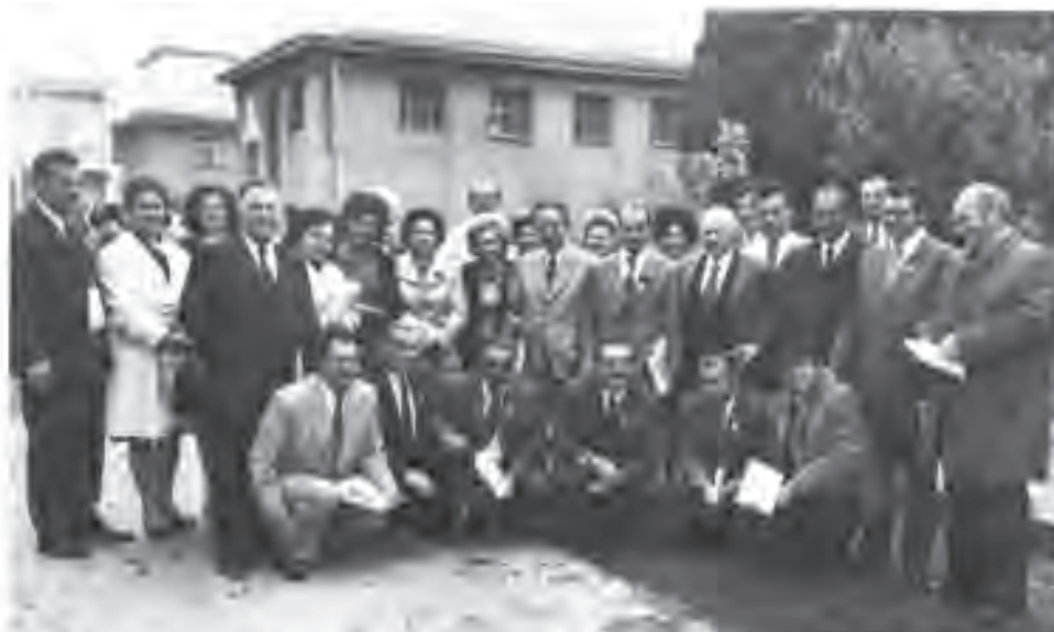
Slika 16. Grupa učenika prve generacije srednje duvanske škole okupljenih u Nišu na 25. godišnjicu od mature.