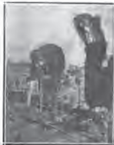
Зламљење цваста и флањење.

pitanja o kojima proizvođač često nema ni pojma. Ti troškovi bi pojedinca progutali ali oslonjeni na državu oni se i ne osećaju. Pored toga proizvođač nije u stanju da svoje skupoceno vreme troši na posmatranja, istraživanja koja iziskuju čitav niz godina sistematskog i istrajnog rada, a koji je vezan sa žrtvama i u vremenu i u novcu. Zato se sve ovo povećava naročitim stanicama, institutima, selekcionim stanicama (ako se bave samo odabiranjem dobrih tipova), oglednim stanicama i t. d. Ogledne i selekzione stanice treba osnivati posebno za svaku