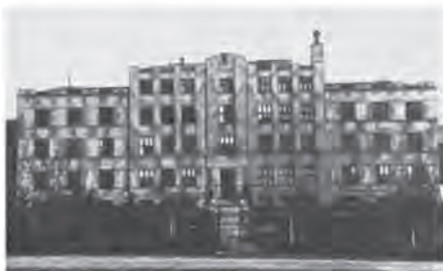
Slika 14. Duvanski institut u Prilepu.

te potpunog okruženja poljem pod duvanom, drugo se ništa nije moglo videti. Takvo jednolično duvansko okruženje još više je potenciralo inače lepu građevinu Duvanskog instituta. Unutrašnjost zgrade takođe je imponantno delovala, s dvama ulazima na sredini, s jedne i druge dužinske strane. Stepenište je veoma široko, od obrađenog kamena, a hodnici su od keramičkih pločica u mozaiku. Cela zgrada je po dužini izdeljena, s udobnim prostorijama za kabinete, laboratorije i ostalo prateće za rad i boravak, kako je u to vreme mogla imati samo razvijena zapadna Evropa. O lepoti i funkcionalnosti tih objekata za vreme Drugog svetskog rata navodno su Bugari govorili: „Šteta što ova zgrada nema točkove, da ih ima, odvezli bi je za Bugarsku“ (sl. 14).