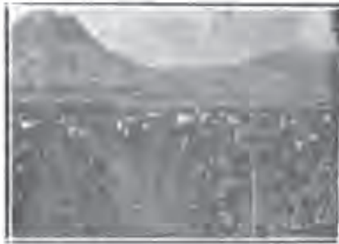
Одабирање дуванских струкова и семењака чија је цваст увијена у косе од гула.

onoj meri kao što je to postigla moderna nauka. Za temeljno upoznavanje duvana i svih onih pojava koje se na kulturi Češavaju od setve pa do fermentacije, osnivaju se opitne stanice — instituti — koji su snabdeveni ne samo skupocenim instrumentima već su naoružani i stručnom snagom koja je u stanju da reši sva ona