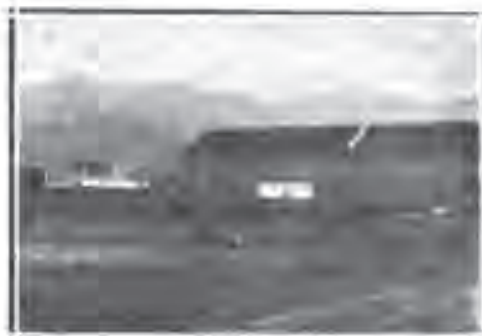
Општа са хубрењем дувана вештачким хубрегом

nica namenjena proizvođačima duvana. Ali se ne treba varati da će Stanica biti od koristi onim proizvođačima koji gajenju duvana ne poklanjaju dovoljno pa-