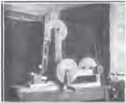
Модел апарата за чишћење дуванског семена.

kojima je Monopolska Uprava poverila ovu dragocenu ustanovu — da uložimo svu svoju energiju u radu, a na Monopolskoj Upravi je: da nam da zamaha i poleta u radu.