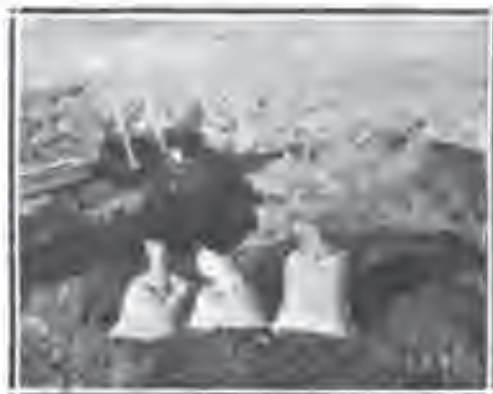
Припрема земље за агротемску педаничку анализу.

gije kao i dinamiku (kretanje) životnih funkcija kod duvanske biljke, Opitna stanica bavi se u glavnom praktičnim — uporednim — ogledima, koje ćemo u nekoliko izložiti.