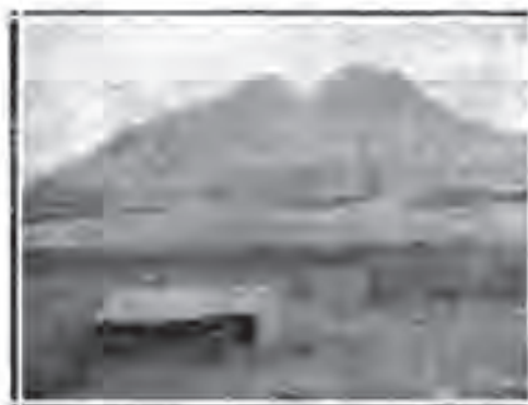
Ođbitno poše sa duvanskom sušnicom u pozadini: Markova Kula.

Ođmah posle oslobodjenja pokrenuto je bilo pilanje o podizanju Opišne Stanice ali posleratna ošpa oskudica nije dozvoljavala da se ideja Ođeljenja za Kulturu i Fermentaciju Duvana privede ođmah u delo. Konačno, uviđevši Monopolška Uprava da je osnivanje Opišne stanice ođ kapitalne vađnosti po razvitak kulture duvana, godine 1924. oktobra meseca, doneto je rešenje, da se u Prilepu pored