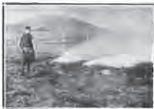
Дезинфекција и жежење земље противу паразита

žnje. Uspeh proizvodnje zavisi od umешnosti i brižljivosti proizvođača. Dakle, unapredenje proizvodnje duvana leži na prvom mestu u njegovim rukama, a tek na drugom mestu dolazi Opitna Stanica koja će ga u radu pomoći. Između proizvođača i Stanice mora da vladaju uzajamni odnosi i tesna saradnja. Opitna Stanica prikupljaće sva ona znanja i iskustva među hiljadama proizvođača, ona će prikupljati i znanja stranih proizvođača pa će sve to proveriti ogledom i onda ona korisna iskustva preporučiti a na štetne upozoriti proizvođače. Stanica se ne osniva samo zato da bi se reklo kako i mi predstavljamo kulturni narod, niti pak da ona